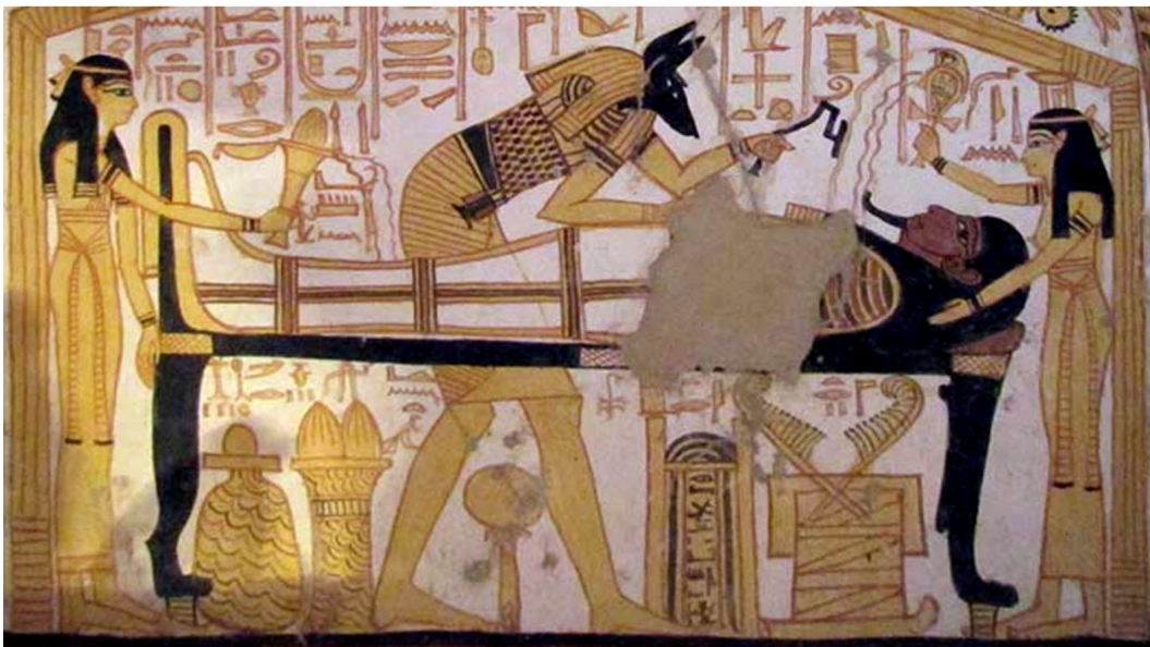
Both goddesses Isis and her twin sister Nephthys are metaphorical glorifications of the Great Pyramid impactor's Hauling rope. Sometimes Isis (the Hauling rope in action, towing the impactor) is represented pulling back Osiris, and sometimes she is pushing him; but the meaning is identical: Isis is the one putting Osiris into motion. Nephthys, the inactive and disconnected same rope, is at his head, resting.

En tándem, Set gobierna sobre los elementos del mundo visible, que es un mundo con la mayoría de la humanidad totalmente cegada en la ignorancia. En consecuencia, Set y Neftis se equiparan con el inframundo, la oscuridad y la noche, siendo uno de los principios masculino y femenino de estas materias de la misma manera que Thoth y Seshat representan el conocimiento.